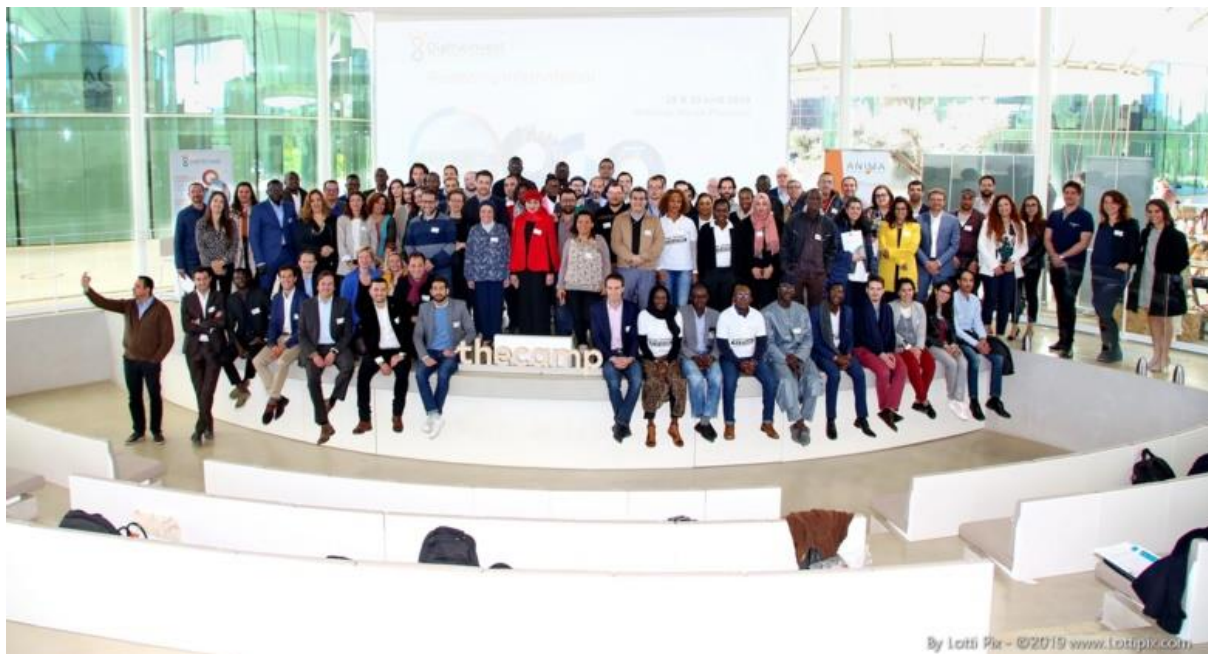
La communauté Diafrikinvest réunie à The Camp (Aix-en-Provence) en 2018.

136 entrepreneurs marocains, tunisiens et sénégalais ont bénéficié pendant trente-six mois du programme européen Diafrikinvest. Coordonné par ANIMA Investment Network, il visait à mobiliser les compétences et développer l'investissement productif de la diaspora issues de ces trois pays.