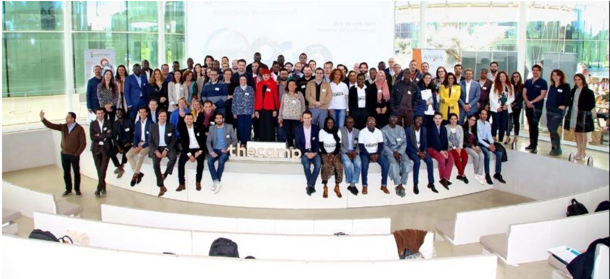
Projets d'entreprenariat sélectionnés

Le projet européen DiafriInvest clôture sa phase d'accompagnement de projets au profit de jeunes entrepreneurs.