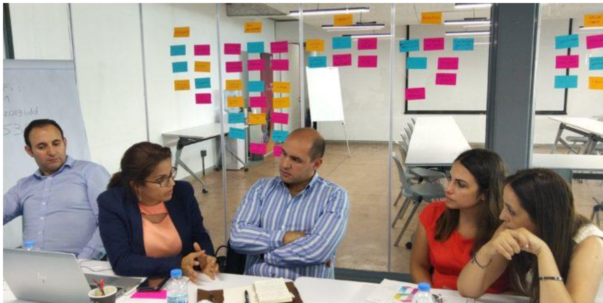
Anima Network et Berytech ont organisé des « master classes » à Beyrouth

Du 30 septembre au 4 octobre 2019 avait lieu à Beyrouth la troisième édition des modules « Master classes », un cycle de formations certifiantes sur le marketing territorial et la gestion de projets de coopération auquel ont pu participer 55 élèves de 8 pays. Ces sessions étaient organisées dans le cadre du projet européen Ebsomed, dont l'objectif est de « renforcer les organisations de soutien aux entreprises et les réseaux d'entreprises dans le voisinage méridional ».