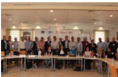
Celebrada en El Cairo la MasterClass

Esta iniciativa formativa, coordinada por la Cámara de Comercio de Málaga, está beneficiando a más de una veintena de jóvenes del Mashreq del sector turístico