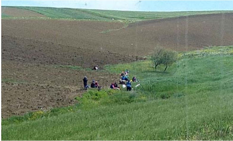
Au milieu des montagnes, des lacs et des prairies...